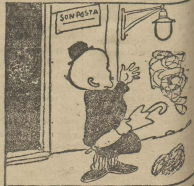
4: Hasan Bey — Yazdık, yazdık, belediye "SON POSTA" sokağına bu feneri astırdı, fakat bir ay oldu, fener hâlâ yanmıyor, ben de şu kısa aklımla anladım ki bu fener mosturaktır.