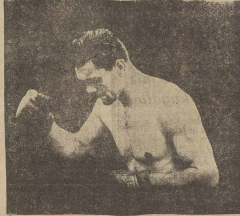
Amerikalılar tarafından cihan şampiyonluğu refedilen sabık şampiyon (Maks Şmeling)

Fark şudur, bu islahatı bir sene sonra yapacağız. Şimdilik 365 gün kaybettik.