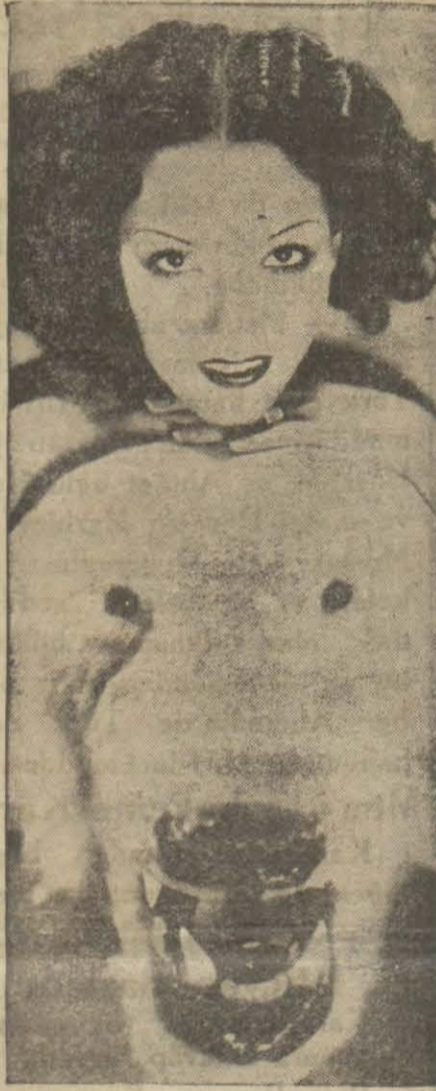
Son zamanda büyük şöret kazanarak Meksikalı Lupe Velez

Con teselliye ve rahata muhtaç olan bir adamdır. onunla evlenecek kadın bunu temin etmeye uğraşmalıdır. Eğer ben onunla evlensem, ona evde herşeyi sükûnet içinde oluyormuş gibi gösteririm. Fakat bunu nasıl yapacağım, diye hiçbir zaman ona sormam. Evin işlerine onu hiç müdahale ettirmem. Con, evden hoşlandığı ve kalabalıktan nefret ettiği halde hiç te ev