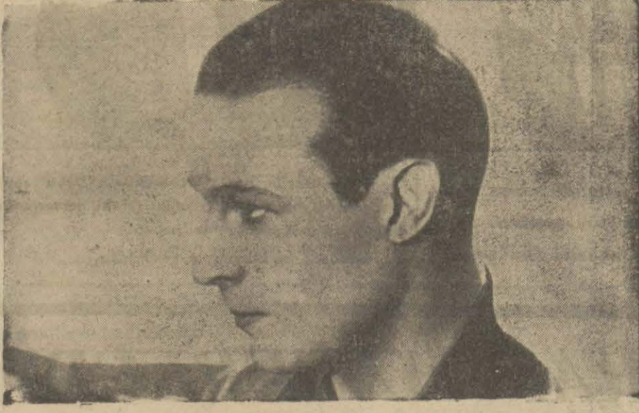
“Rudolf Valentino”, nun. son resmi