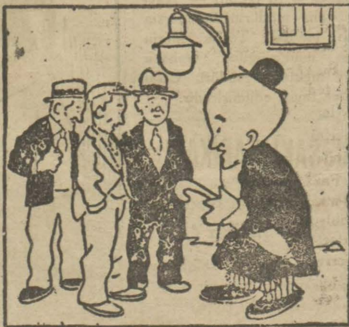
2: Hasan B. — Bu fener satılıktır. İstiyen olursa Belediyeye müracaat etsin.