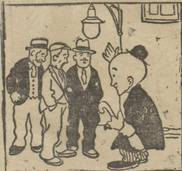
1: Hasan Bey — Yolcular!.. Bakın, şu feneri görüyor musunuz?